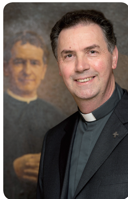
Padre Ángel Fernández Artime, SDB 10º Sucessor de Dom Bosco

Há, portanto, um convite explícito a vivenciar e testemunhar a perfeição do amor, que não é diferente da santidade. A santidade mesma consiste, de fato, na perfeição do amor; um amor que, antes de tudo, se fez carne em Cristo.