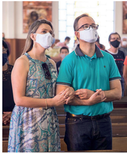
Devotos também participaram do evento de forma presencial.