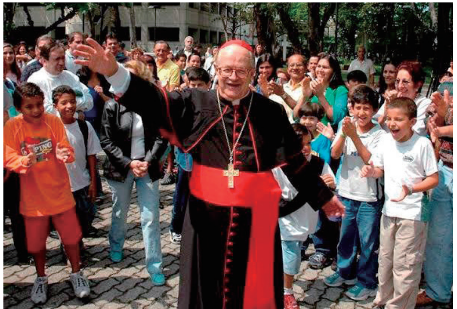
O Cardeal foi o primeiro bispo da Diocese de São José dos Campos