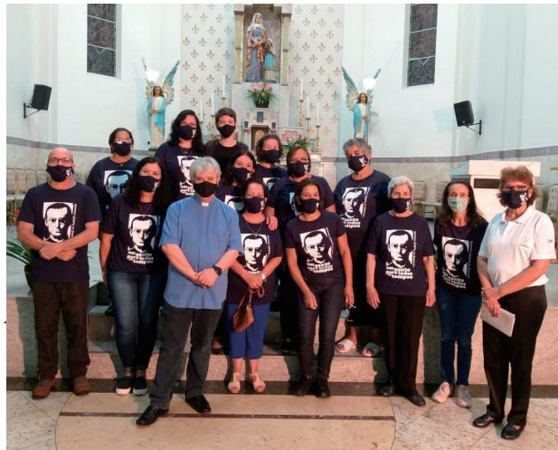
Primeira formação do Movimento Padre Rodolfo Komorek