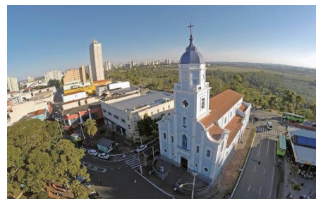
Paróquia Matriz São José

Destacavam-se nele fortemente neste período os conselhos evangélicos de pobreza, castidade e obediência. Tratava a todos com grande respeito. Cumprimentava sempre tirando o chapéu e fazendo uma grande inclinação e dizendo: “Seja louvado Jesus Cristo!”. Em São José dos Campos há diversos testemunhos de que, devendo sair