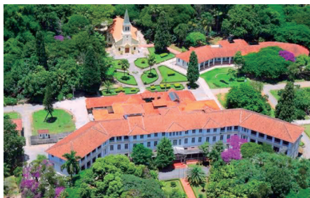
Sanatório Vicentina Aranha

cramentos aos enfermos, ia de boa vontade, mesmo que o doente morasse longe ou, às vezes, em plena zona rural. Relata-se que converteu a muitos doentes, mesmo os mais arredios à confissão. Todos na cidade o chamavam de “o Padre Santo” e pediam a bênção de Nossa Senhora Auxiliadora. Até da roça vinham buscá-lo para dar esta bênção aos doentes e ele, com toda atenção e amor, satisfazia a todos. Sempre que possível, ia a pé, evitando pegar táxi ou charrete. Há vários relatos de que em algumas vezes ele chegava não se sabe como, sem que ninguém o tivesse chamado, e ministrava os Sacramentos ao enfermo.