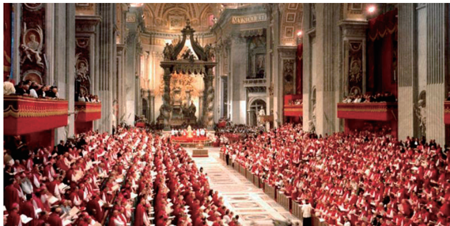
Abertura do Concílio Ecumênico Vaticano II - 11 de outubro de 1962