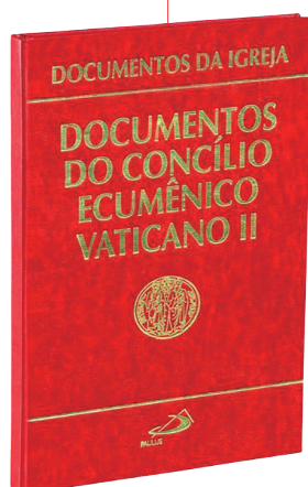
Compêndio de Documentos do Concílio Vaticano II

A Igreja Católica com o Concílio Vaticano II (1962-1965) procurou se atualizar ( aggiornamento ) para melhor se adequar às realidades sociais e culturais contemporâneas. Atualizações eclesiais estas que tiveram um olhar tanto para dentro como para fora da Igreja. Destacam-se por exemplo as definições da Constituição Dogmática Lumen Gentium (1964), um dos documentos daquele Concílio, que declara que a Igreja, em seu plano natural, é formada por todo o povo de Deus, o qual integra os clérigos, religioso(a)s e leigo(a)s em condições de igualdade, reforçando que os membros da hierarquia estão a serviço de todo o povo de Deus. Este reposicionamento da Igreja vem sendo reforçado por todos os Papas que se seguiram ao Vaticano II até nossos dias, inclusive com o Papa Francisco que, já em seu primeiro ano de papado, enfatiza na sua Exortação Apostólica Evangelii Gaudium (2013) que toda a Igreja, povo de Deus, deve servir a humanidade em permanente saída, indo ao encontro dos que precisam.