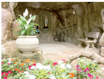
Gruta Nossa Senhora de Lourdes

Na hora da Ave-Maria, às 18 horas, teve início a Solene Celebração Eucarística, no átrio da Capela do Parque, na qual, o Coro Madrigal Ir. Miria Therezinha Kolling, da Diocese de São José dos Campos, cantou a Missa "Glorifica minha Alma ao Senhor". Ao final da celebração, após a bênção das imagens sacras restauradas, os presentes foram convidados a seguir em procissão luminosa até a Gruta. O momento foi acompanhado com emoção pelos fiéis, que entoaram o "Ave de Lourdes".