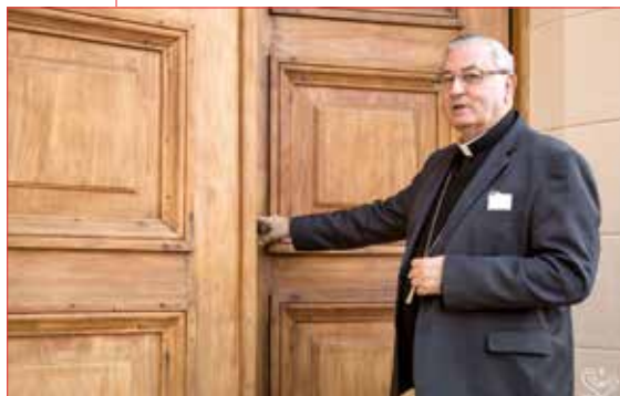
Bispo Diocesano de São José dos Campos reabriu a Capela

fim, abriu oficialmente as portas da Capela Sagrado Coração de Jesus, detendo-se em alguns momentos de oração diante do altar-mor.