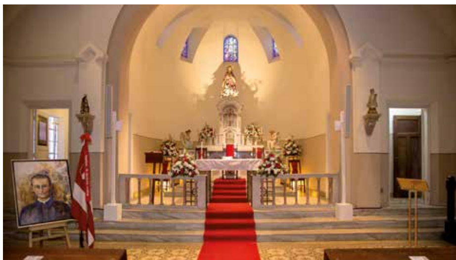
Capela Sagrado Coração de Jesus - Parque Vicentina Aranha