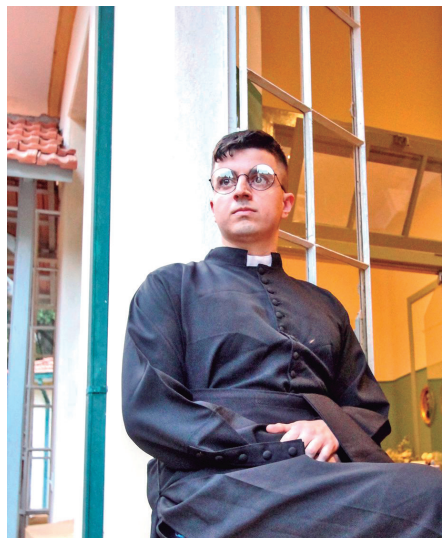
Pe. Rodolfo Komorek (Ator: Matheus Rocha)