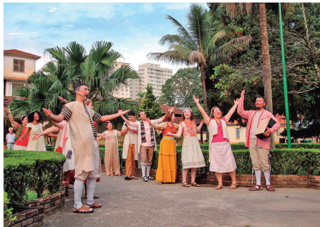
Companhia Virgem de Nazaré na apresentação do dia 11 de dezembro

A Procissão Memória se constituiu de dois momentos: o primeiro, oracional – uma Celebração da Palavra; o segundo, cultural – um musical, com a Companhia Virgem de Nazaré. Cerca de trinta jovens artistas interpretaram importantes personagens da história da fase sanatorial da cidade, dentre eles, o