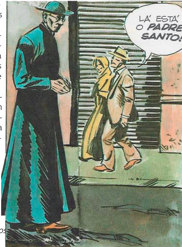
O povo dos lugares onde o Venerável trabalhou chamavam-no de “O Padre Santo”.

Quantos se alegraram com esta luz! Quantos reencontraram a fé perdida, quantos abatidos recuperaram a esperança, quantos pecadores vol-