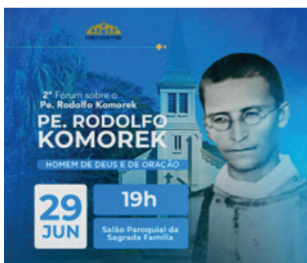
Cartaz divulgativo do 2º Fórum sobre o Ven. Pe. Rodolfo Komorek

to é aberto, no lugar onde ele viveu e morreu, um processo de beatificação e de canonização. Portanto, para fazer progredir este processo, há a necessidade de um grupo de pessoas que cuidam de todos os encaminhamentos exigidos durante os cuidadosos trabalhos que a Igreja conduz, até que aquele candidato possa ser canonizado e reconhecido como 'santo'.