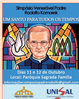
Banner divulgativo do primeiro evento (11 e 12 de outubro de 2019)

Como acentuou Dom Hilário Moser, sdb (Bispo Emérito de Tubarão, SC), um dos ilustres palestrantes deste evento, os Santos não são propriedades particulares de um país, de uma diocese, de uma inspeção ou de uma comunidade paroquial. Eles são santos para toda a igreja e para todos os tempos .