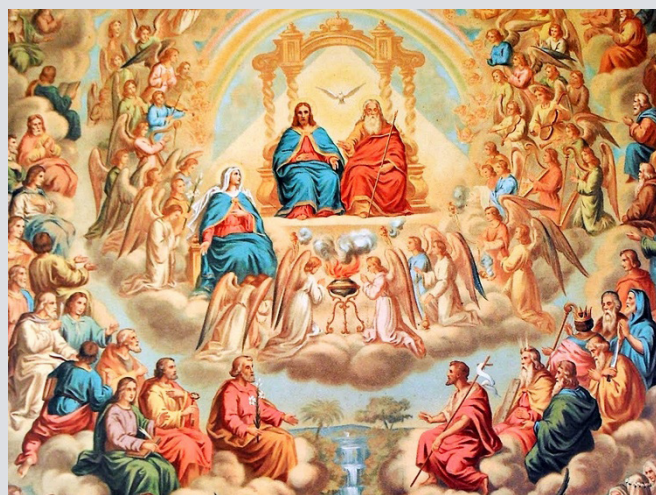
Os santos, por sua vida santa aqui na Terra, ganham o prêmio da Glória Eterna junto de Deus.

Para Deus: esta dimensão nos leva a glorificar a Deus e a reconhecer a grandeza de nosso Deus; a nossa total dependência dEle e, consequentemente, o direcionar tudo o que somos, fazemos e temos para a Sua Honra, Glória e Louvor, com a intenção de agradá-Lo sempre e em tudo.